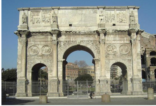
Iglesia de San Andrés de Alberti Arco de triunfo romano.

Aquí se aprecia cómo se traspasan los órdenes clásicos y el arco de medio punto. Por otra parte, Alberti se inspiró para la fachada en este arco de triunfo de Constantino