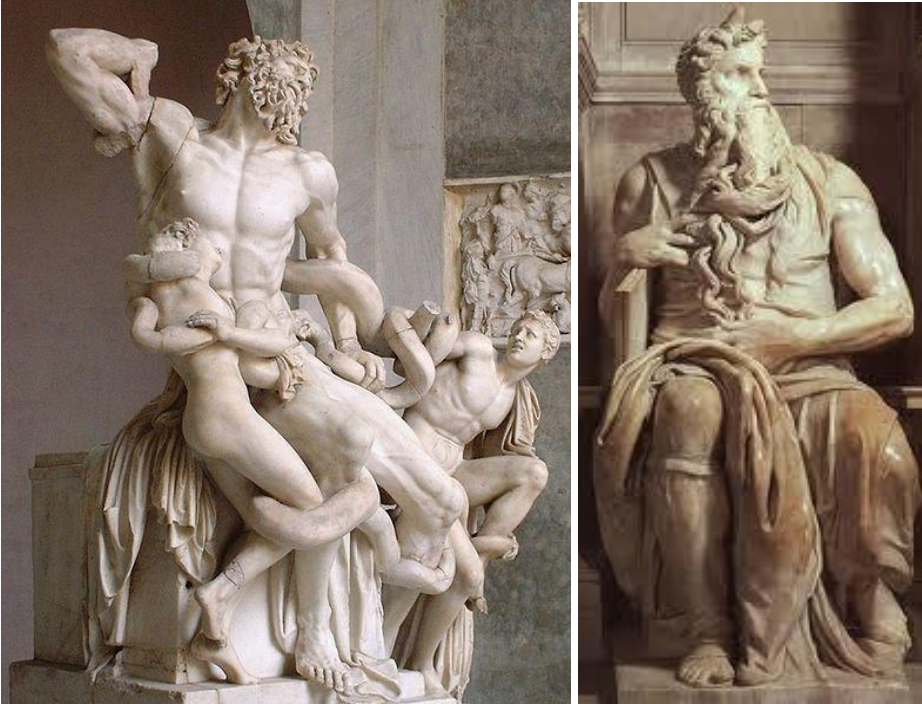
Laocoonte. Periodo helenístico del arte griego. Moisés de Miguel Ángel

Otros autores como Miguel Ángel se inspirarán en periodos más tardíos del arte griego (helenismo) para iniciar la última parte del renacimiento, el manierismo (en donde se pierde la proporción y la armonía y se busca la expresividad y la tensión).